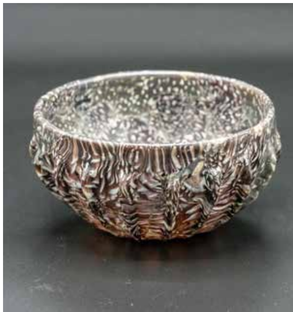
De laat-romeinse glazen drinkbeker van Servaas, die pelgrims kregen aangeboden om uit te drinken. Ook pelgrim Arent drinkt uit deze 'cop'.

'Zo werden ons veel zeer mooie relieken getoond', constateerde Arent die avond vergenoegd in zijn dagboek. 7 De pelgrims zagen in de verborgen schatkamer ook nog Servaas' bisschopsstaf en Servaas' palster: de pelgrimsstaf waarmee Servaas het Heilig Land bezocht had, en op de grond had geslagen, waarna een geneeskrachtige bron aan de aarde was ontsprongen, zo had de